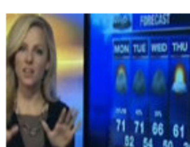
Sorprea en directo de la chica del tiem...