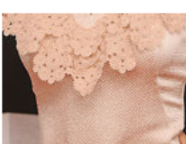
La actriz que rechazó ser preciosa