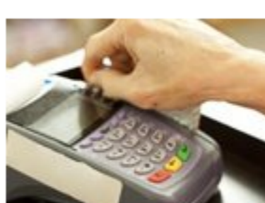
Cuidado, así pueden clonar tu tarjeta